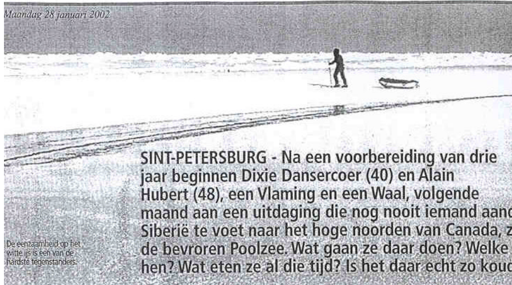
De eenzaamheid op het witte ijs is een van de hardste tegenstanders.