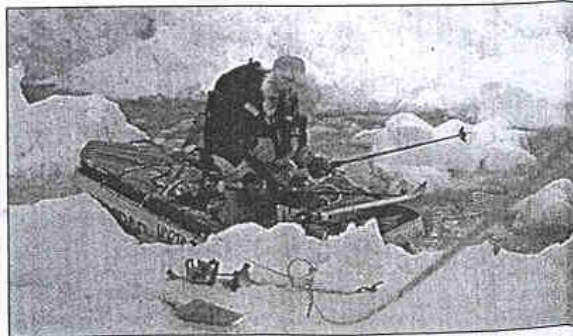
Er moet oereeld ook al eens een rivier overgestoken worden.

bedwingen. De skilatten houden beide sledes bij elkaar en hun sneeuwschoppen doen dienst als roeispaan. Om sneller te gaan zullen de twee ook gebruik maken van een parafilm, een groot zeil dat ze wat sneller naar Noord-Canada moet brengen. Ze zou-