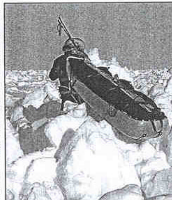
Het landschap is niet altijd vlak.

■ De expeditie is te volgen op www.antarctica.org , waar ook geregeld recentste foto's verschijnen